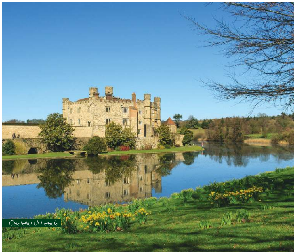
Castello di Leeds

N.B.: Possibilità di estendere il soggiorno a Londra all'inizio o alla fine del tour. Quotazioni su richiesta.